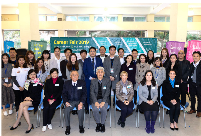
▲ 參展機構代表與大學管理層、學系教授和教職員與合照。