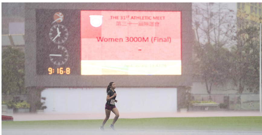
▲ 女子3,000米賽跑進行期間，雨勢增大。

由於無法完成所有比賽項目，籌委會決定本年度不設系際全場總冠軍、男子和女子個人全場總冠軍。