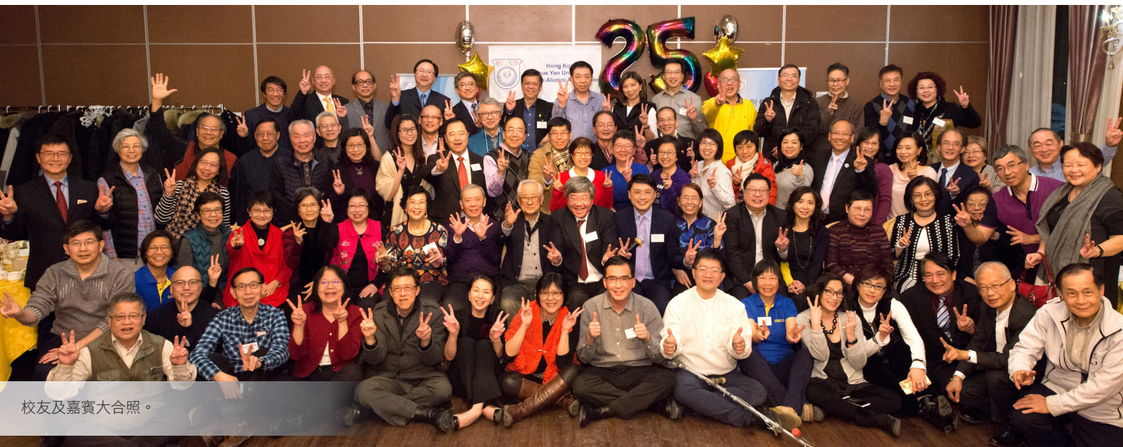
校友及嘉賓大合照。