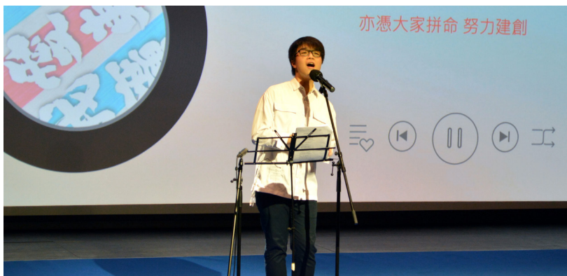
▲ 樹仁大學音樂及音響製作學會代表演繹參賽作品。