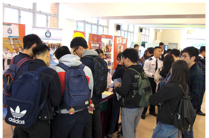
▲ 參與展的同學向機構代表查詢和進行交流。